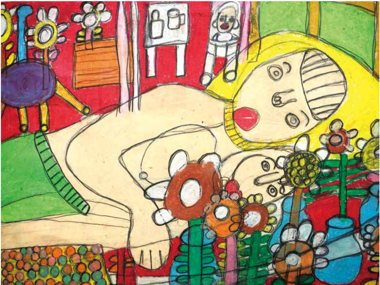
絵:「母と子」高橋孝充 (当日、体育館に展示します)

2023 10.1 (日) inしあわせの村 10:00 ~ 15:00 (中央緑道・芝生広場・体育館)